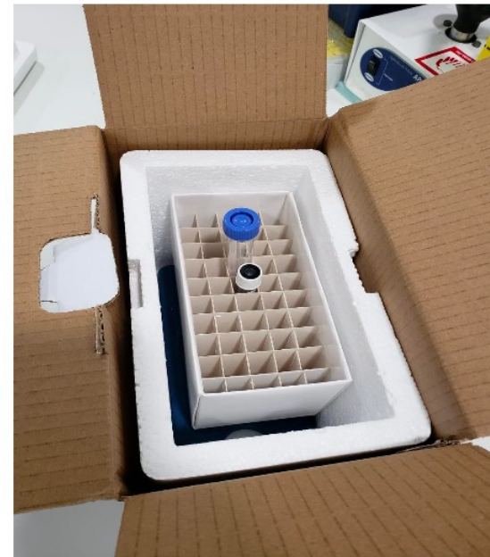
Amostras acondicionadas na vertical em caixas colmeia dentro da caixa de isopor