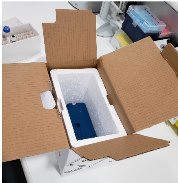
Caixa de isopor com gelox, dentro de caixa homologada para transporte de amostras biológicas